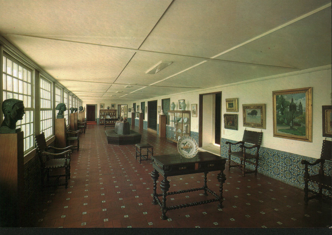
2073 - BRAGANÇA - PORTUGAL. Galeria de Artes Decorativas. Galerie d'Art Décorative. Decorative art gallery.

Ministério da Educação Nacional Secretaria de Educação Cultural Direcção Geral dos Assuntos Culturais Museu do Abade de Baçal Bragança