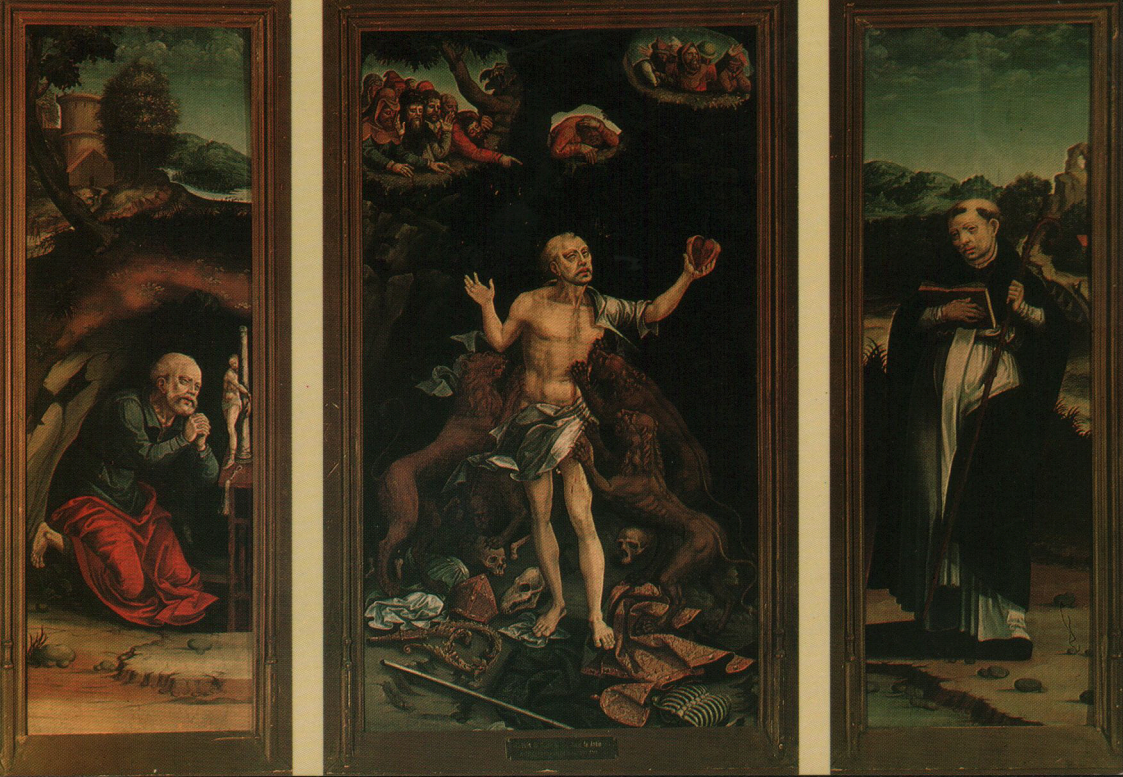
2071 - BRAGANÇA - PORTUGAL. Triptico, Martírio de St o . Inácio. Óleo sobre madeira. Autor Desconhecido, sec. XVI. Triptyque, Martyre de St Ignace. Peinture à huile sur bois. Auteur Inconnu. XVI e . siècle. Triptych, Martyrdom of St. Ignatius. Oil painting on wood. Unknown author. XVlth century.

Ministério da Educação Nacional Secretaria de Educação Cultural Direcção Geral dos Assuntos Culturais Museu do Abade de Baçal Bragança