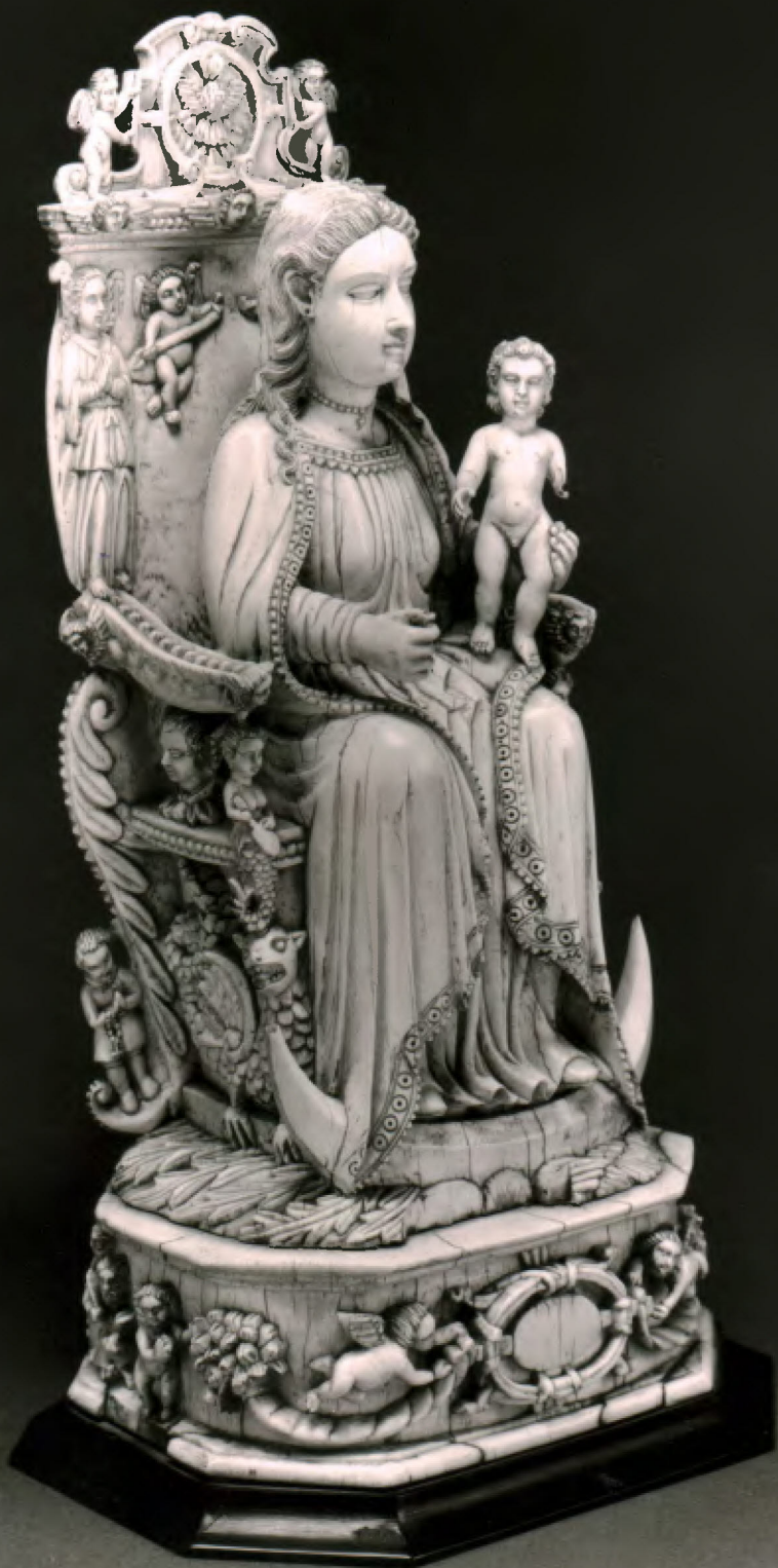
Imagem existente no México c/ A = 32 cm. Diapritivo en- viado por D. Pedro Pinheiro em Julho 980, de que extrai esta prova.

Adoração às cartelas, vários si- gnos da cruz e suas cabeças, das lozes com ferro, perleis, bocas do viola, cornucópias, palmas, aves-dragão (ver provas i. p.) e Opicua da imagem, a mesma do exempl. do Fernando e Dr. Amaral Cabral. Outras fura- tas já no México (?), esta em- gido odcensista, mas debruns do mundo e fúruica peincensista.